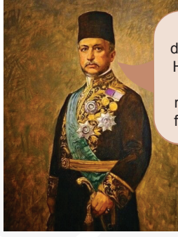
Sait Halim Paşa

Toplumun temel direği dindir. Din ile millet birdir. Hangi milletten olurlarsa olsunlar bütün Müslümanların, halifenin etrafında birleşmesi gerekir.